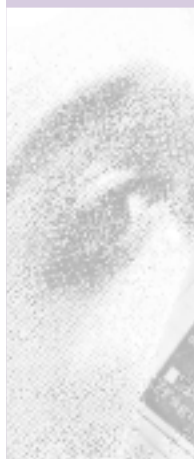
Centro técnico educativo