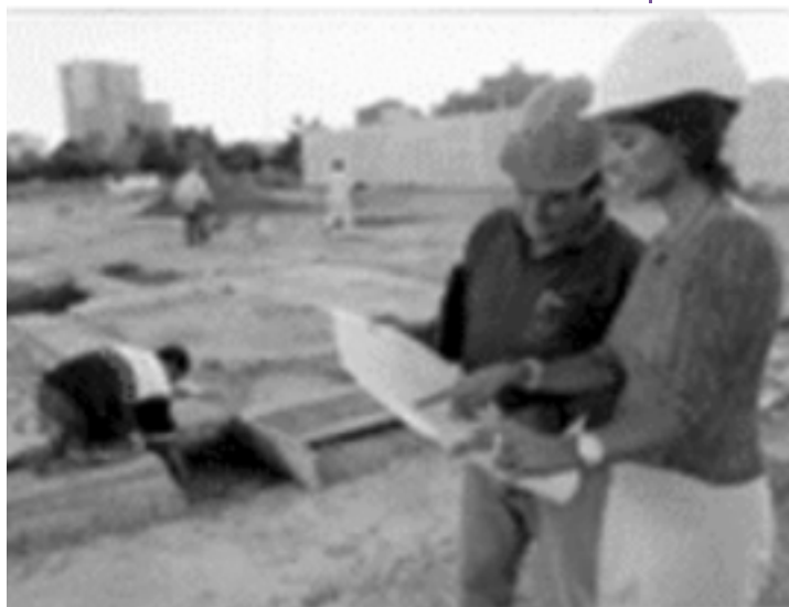
Proyectos de construcción